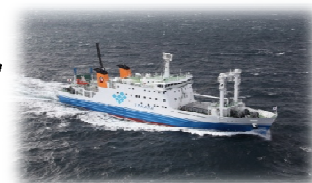
新船「フェリーとしま2」