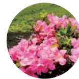
村花 マルバサツキ